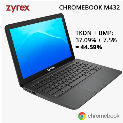
Zyrex Chromebook M432-2 15 unit