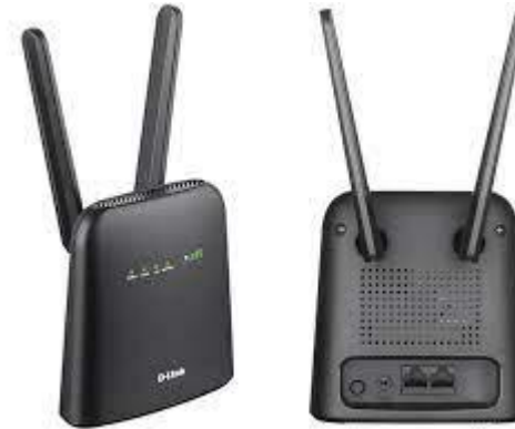
Dlink 4G Wireless Router 1 unit