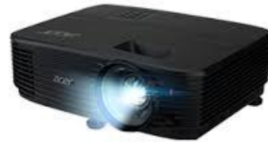
Acer Projector DX210 1 unit