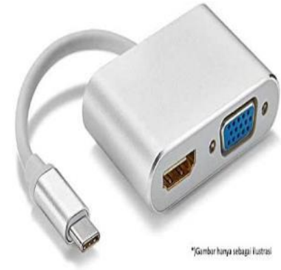
Connector USB type C to VGA & HDMI 1 unit